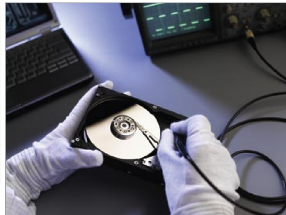
Cleanroom van Attingo.

De komende tijd zal Brans zich in Nederland bezighouden met een marketingcampagne om Attingo ook in Nederland op de kaart te zetten. "We zullen ons niet alleen commercieel manifesteren, maar ook deelnemen aan discussies